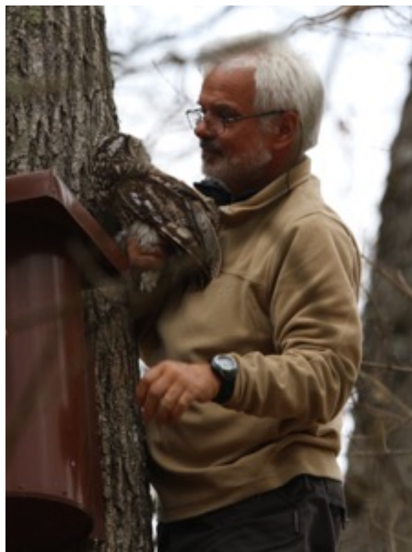
Capture d'une femelle à la main.

L'analyse des surplus trouvés dans les nids lors des contrôles a révélé la présence de 96 proies. Parmi celles-ci 61 (63,5%) étaient des mulots Apodemus . Lorsque la distinction a pu être faite, les Mulots à collier étaient environ deux fois plus abondants que les sylvestres (13 contre 6). Seuls 16 Campagnols roussâtres Myodes glareolus (16,7%) ont été trouvés ainsi que 15 Microtus ( arvalis et agrestis ) (15,6%). Les autres proies, un Muscardin Muscardinus et 3 Grives musiciennes Turdus philomelos sont anecdotiques. Ce sont donc bien clairement les Mulots qui furent à l'origine de cette belle réussite.